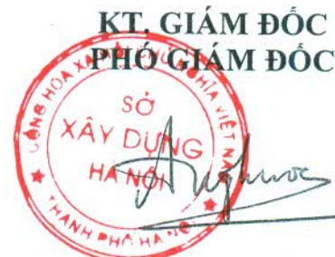
Đông Phước An